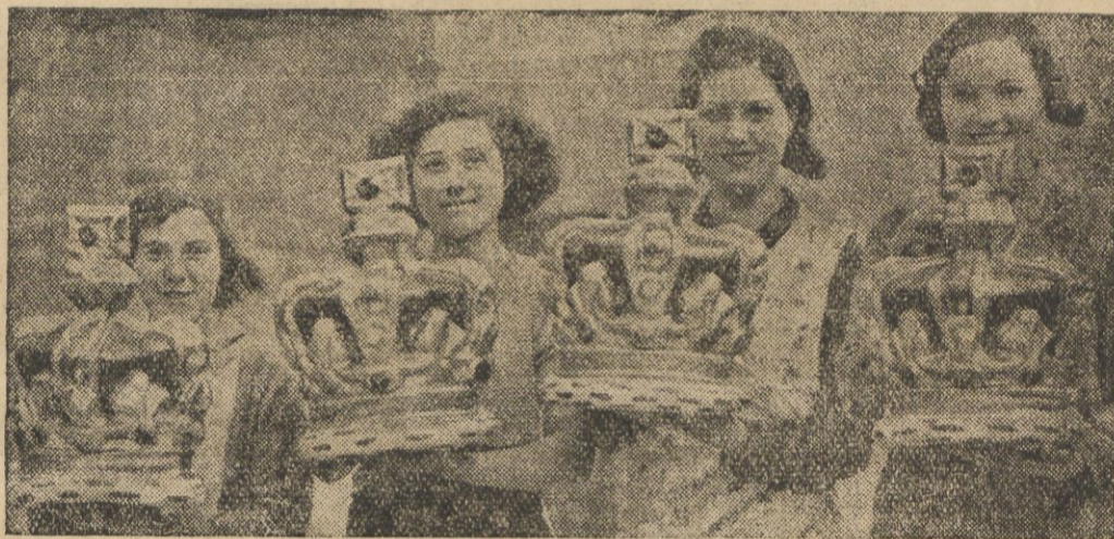
Podczas 25-lecia panowania Jerzego V będą w Anglii urządzone liczne uroczystości. W Londynie będą płonęły fajerwerki przed pałacem króla. Na ilustracji cztery korony zaopatrzone w sztuczne ognie.