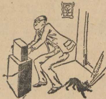
... zdaje się że zlapałem Japonię...