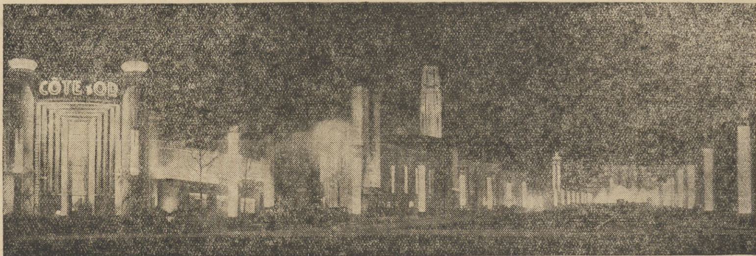
W sobotę król belgijski Leopold dokonał otwarcia światowej wystawy w Brukseli. Na ilustracji fragment wystawy w oświetleniu nocnym.