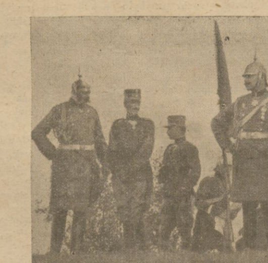
Cesarz Wilhelm ze sztabem na manewrach jesiennych w roku 1913.