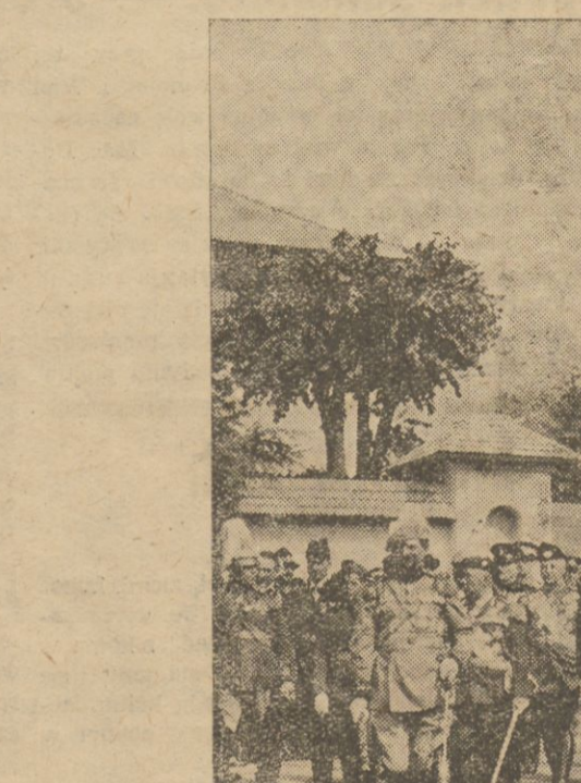
Do Sinaia, letniej rezydencji króla rumuńskiego przybył król jugosłowiański Aleksander, w celu wzięcia udziału w obchodzie 60-lecia pałacu królewskiego, oraz w uroczystości odsłonięcia pomnika króla Karola I i jego następcy. Na zdjęciu król Karol II (z lewej), król Aleksander, w ks. Mikołaj (za królem Aleksandrem) po wyjściu z monastynu w Sinaia.