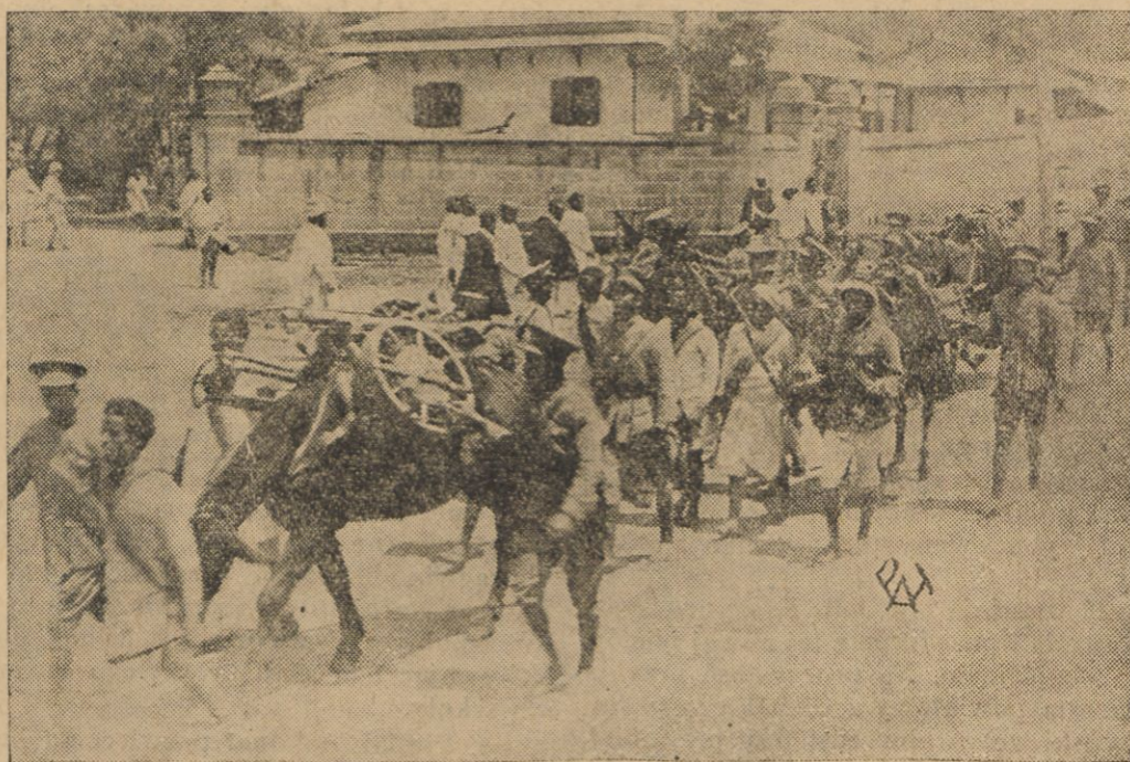
Transport amunicji z Addis-Abeby do pogranicznych okręgów abisyńskich. Do transportu używane są muły.