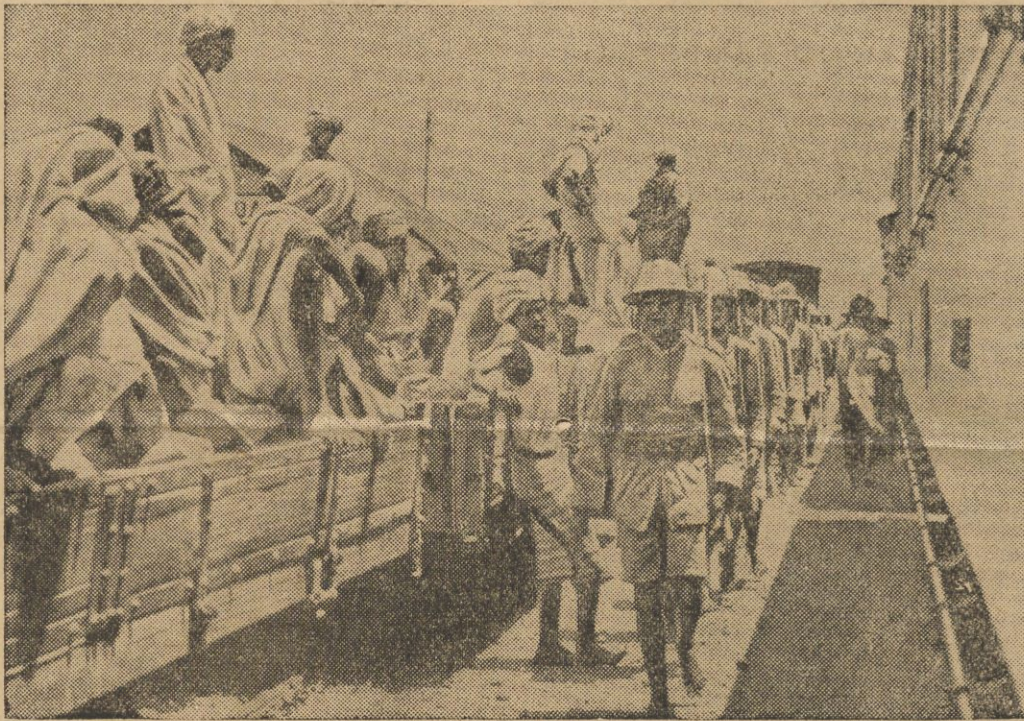
Najnowsze zdjęcie z Abisynji — pociąg z transportem wojska na dworcu w Addis Abebie. — Według ostatnich wiadomości w tych dniach znów wysłano 5000 żołnierzy oraz znaczną ilość materiału wojennego z Addis Abeby do Diredouy.