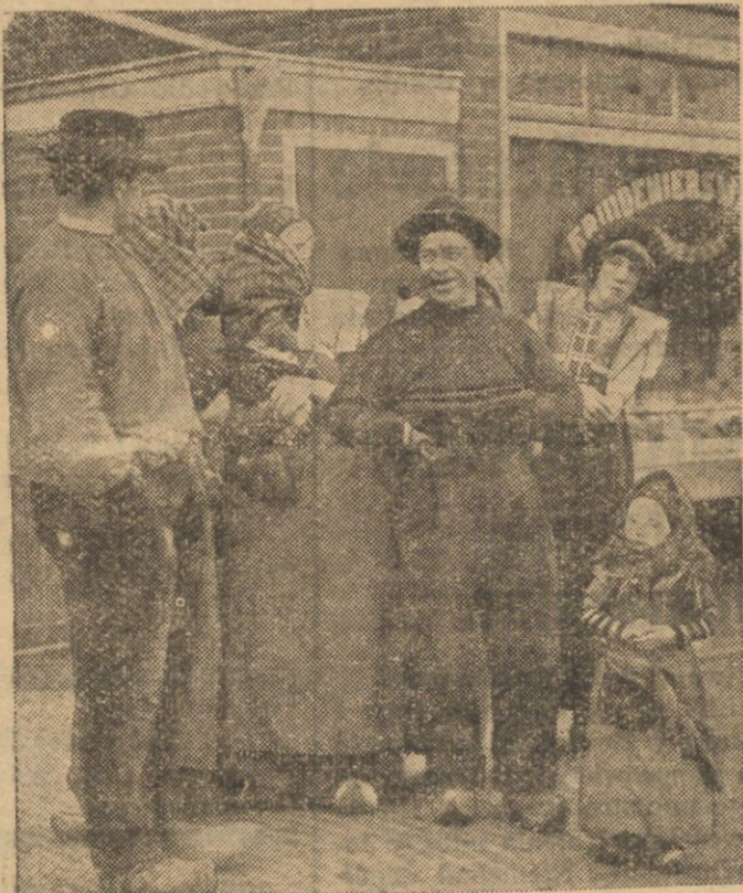
Wzrasta Svestdijk, gdzie ks. Juliana holenderska ma zostać matką, prowadzą ożywione rozmowy na temat urodzin następcy tronu.