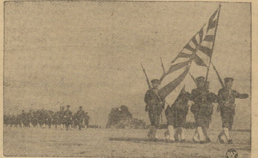
Czołówka defilady wojsk garnizonu tokijskiego ze sztandarem, zorganizowanej przez Dowództwo Japońskie na cześć zwycięstw japońskich w Chinach Północnych.