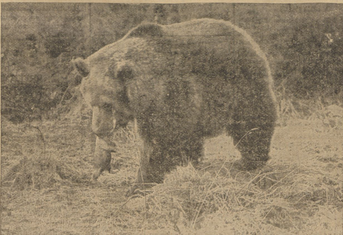
Niedźwiedzica z ogrodu zoologicznego w Whipsnades (Anglia) powiła niedawno potomka, którym opiekuje się z niezwykłą troskliwością. Na zdjęciu widzimy, jak szczęśliwa mama przenosi swe male w zębach — powoli, ostrożnie i delikatnie.