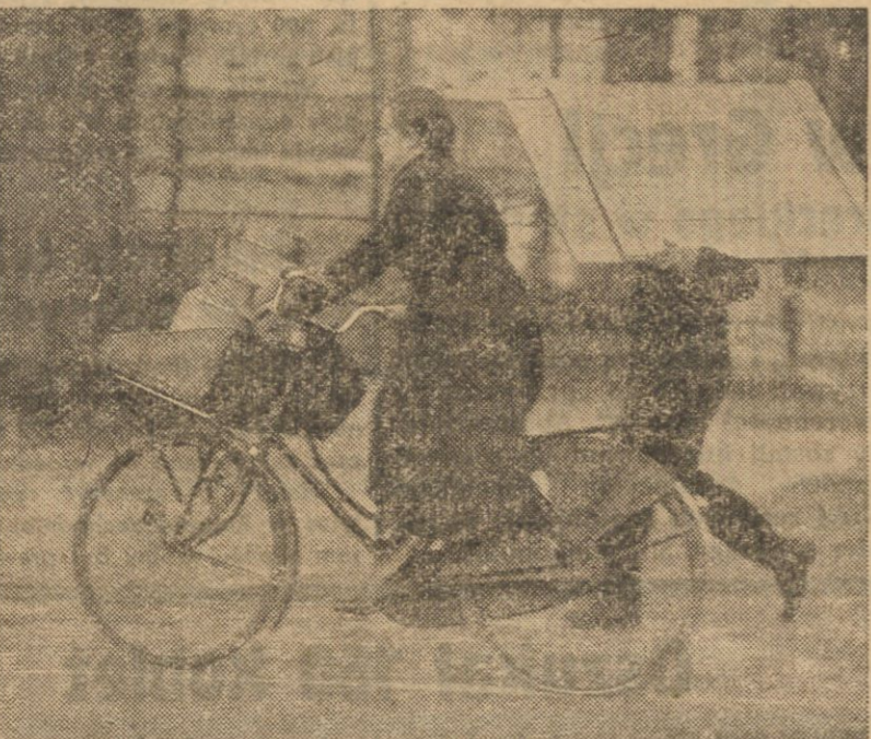
Mleko dla ks. Juliany dostarcza się specjalnie z pewnej wsi pod Hagą. Z dworca kolejowego w Soesdijk na zamek dowozi je na rowerze kobieta, którą widzimy na zdjęciu.