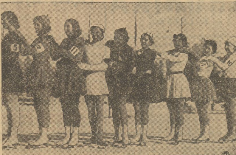
Zawodniczki francuskie, biorące udział w mistrzostwach świata w jeździe figurowej na łyżwach w St. Moritz. Pierwsza od lewej słynna Cecilia Colledge.