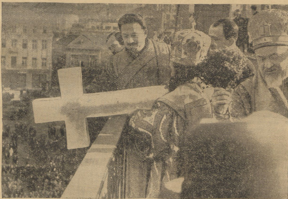
Coroczna uroczystość wrzucania krzyża złodu w fale Dunaju, nabrała w tym roku specjalnego znaczenia ze względu na niedawny zatarg pomiędzy ortodoksami prawosławia a katolikami. Fotografii dokonano w momencie, gdy metropolita wrzuca krzyż do rzeki z mostu — ceremonii przyglądają się tłumy mieszkańców, zalegające brzegi Dunaju.