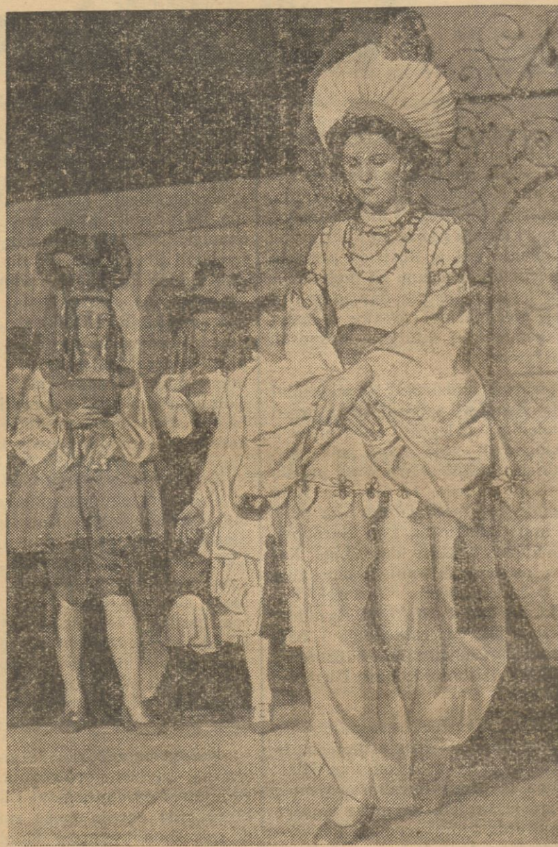
Sezon karnawałowy w całej pełni. Bale kostiumowe są terenem najrozmaitszych pomysłów oryginalności. Oto kostium na zabawie pod nazwą „Z tysiąca i jednej nocy“.

spisprzeżeń, co przyczyniło się do ujęcia Skwierawskiego. Można nawet przypuścić, że gdyby prasa wcześniej ogłosiła te szczegóły, morderca nie mógłby przebywać przez kilka dni po morderstwie w stolicy, nie kryjąc się zresztą zupełnie.