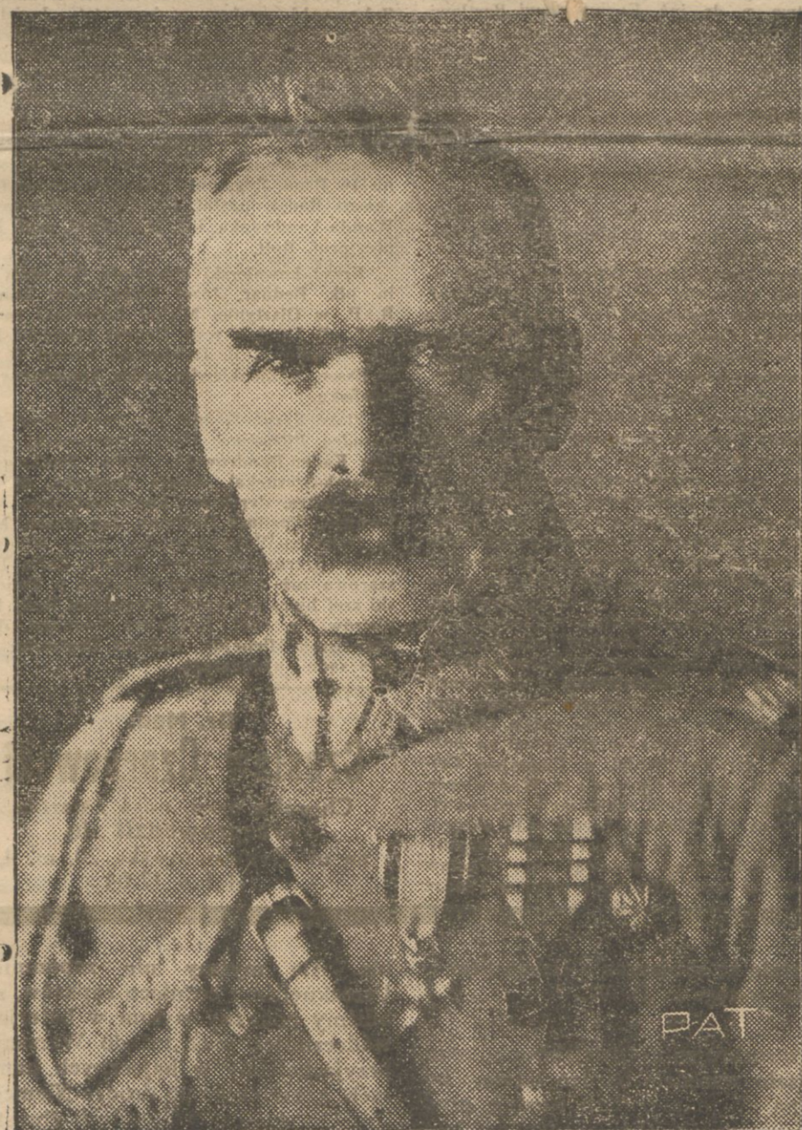
Marszałek Józef Piłsudski.

PARYŻ, (Pat). Herriot przyjął- wczoraj ambasadora włoskiego w Pa- ryżu. W tutejszych kołach politycz- nych przywiązują wielką wagę do wi- zyty ambasadora włoskiego nazajutrz po przemówieniu Herriot'a w Tuluzie. Jak utrzymują ambasador miał w imieniu swego rządu podziękować Herriotowi i zapewnić go o wielkiem i przychlnem wrażeniu, jakie jego o- świadczenie w sprawie stosunków francusko-włoskich wywarło w Rzy- mie.