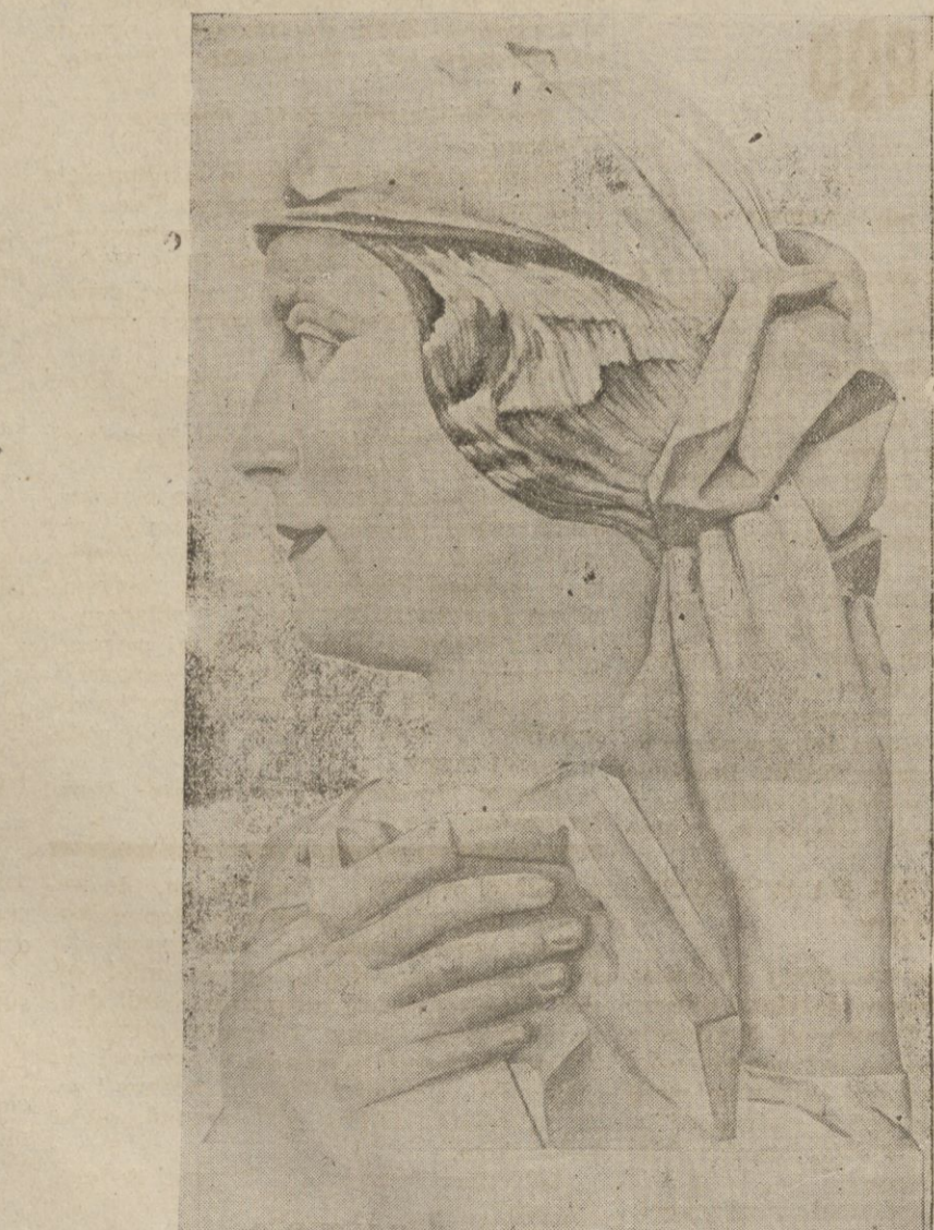
Ludomir Słendziński (rzeźba w drzewie)

SOSNOWIEC, PAT. — Zarząd kopalni „Heleny” zażądał od dłuższego czasu z zapłatą zarobków robotnikom na wysokości 150 tysięcy złotych, do spłacenia których nie można go było skłonić. W związku z tem odbyła się wczoraj rozprawa karno-administracyjna w starostwie w Beżynie. Wszyscy inni wspólnicy i dyrektor kopalni „Heleny” skazani zostali za niewypłacenie robotnikom zarobków i etagle odwiekanie wypłat na trzy miesiące bezwzględniego więzienia, bez zamiany na grzywnę.