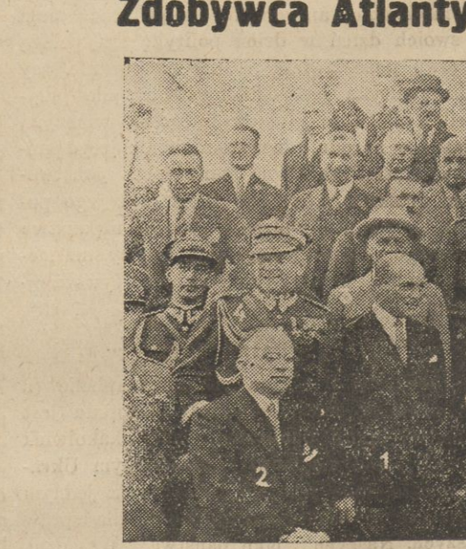
Wczoraj przybył do Warszawy na swym słynnym samolocie R.W.D. zdobywca Atlantyku południowego, kapitan Skarżyński, witany na lotnisku przez przedstawicieli władz, generalicję, dyplomację oraz przedstawicieli społeczeństwa. Na zdjęciu naszym widzimy (3) marsz. Sejmu p. Świątalskiego (2), wicemin. gen. Fabrycego (4), gen. Orlicz - Dreszera.

Zniwa w pełni; — na wsi jest to chwila osobiwa, gdy ręk do pracy stała braknie w większych gospodarstwach, gdyż żniecia nie pójdzie do dworu, nim u siebie nie żniecie i nie pomoże swatom i kumom mającym większe zasiewy.