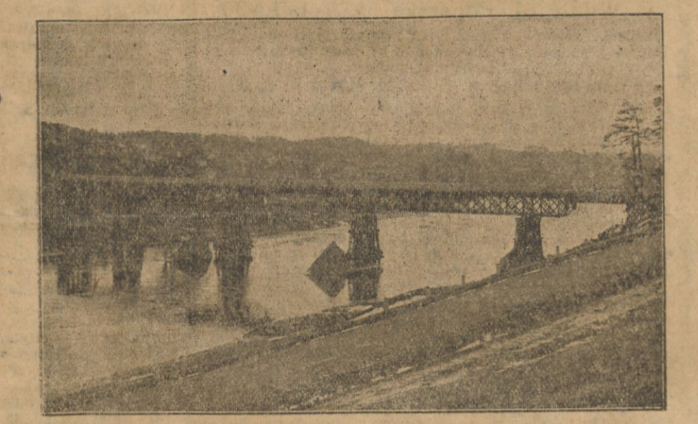
Nowy most na Wilji łączący Antokół z Tuskulanami.

wspaniale świadczy o ich sprawności. Dzień niedzieli miał jeden bardzo znamienity rys, był dniem świętem pracy wojska dla cywilów, był stwierdzeniem i przykładem możliwości pracy armii dla społeczeństwa, a pomadto był egzaminem sprawności naszych wojsk technicznych. Uroczystości wypadły bardzo okazałe i bardzo serdeczne.