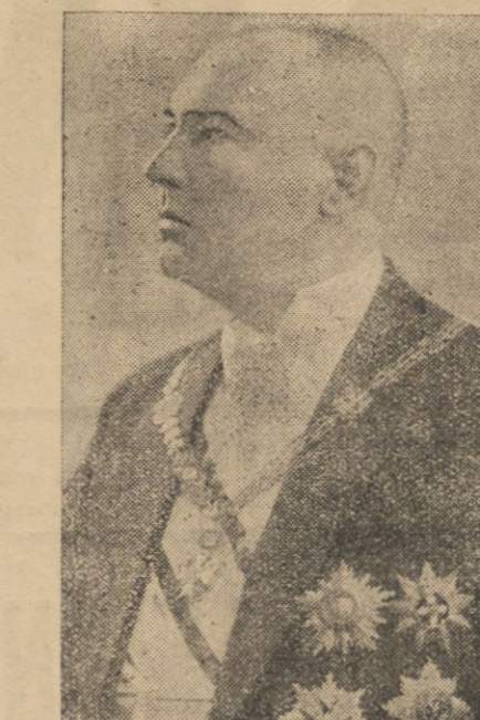
Dn. 18 b. m. państwo łotewskie obchodzi 15-ty rocznicę swej Niepodległości. Na zdjęciu Prezydent łotewski Albert Kwiesiński.

Istotnie niezła zachęta dla Hitlera. — q. m.