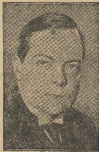
Ambasador Leon Noel.

WARSZAWA. (Pat). Dnia 29 maja o godz. 12.30 Prezydent Rzeczypospolitej przyjął na Zamku Leona Noela, ambasadora Francji, który złożył swe listy uwierzytelniające i odwołujące jego poprzednika.