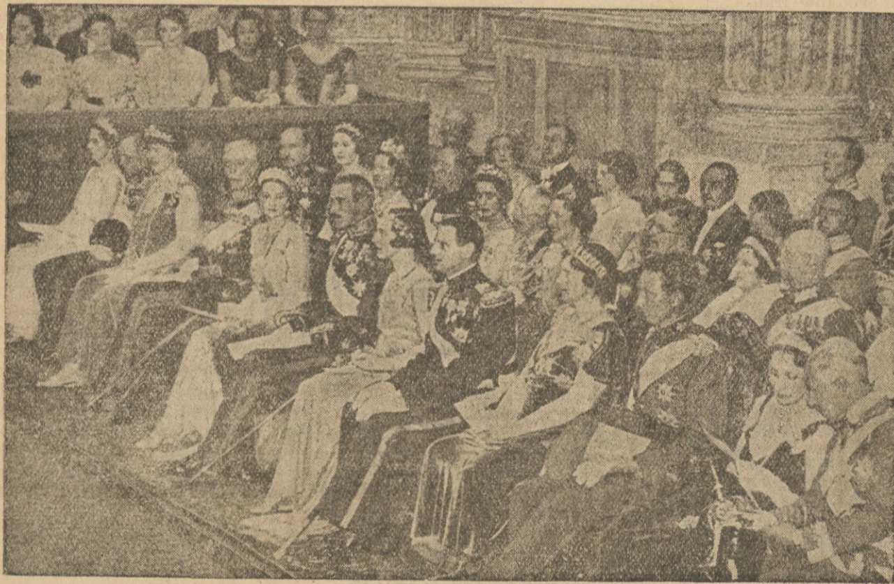
Goście weselni na zamku królewskim w Sztokholmie.

Pozatem znajdują się w powietrzu niewielkie ilości kwasu węglowego, ślady ozonu, amoniaku, kwasu siarczanego, a niekiedy oksydatu węgla. W azocie atmosferycznym odnaleźć można 1 proc. argonu, oraz ślady kryptonu, neonu i metargonu.