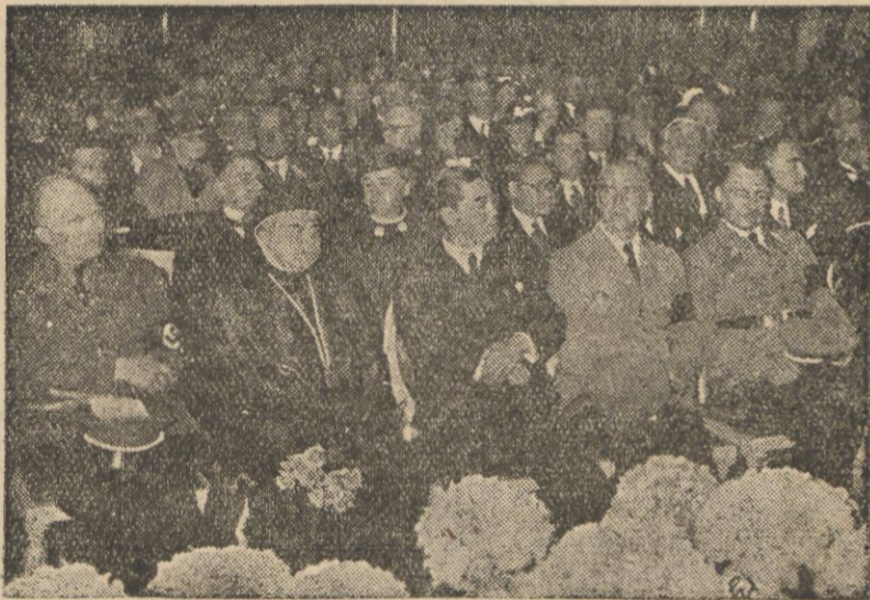
W uniwersytecie berlińskim odbyła się uroczysta akademja dla uczczenia 25-iej rocznicy śmierci znakomitego uczonego bakterjologa, odkrywcy prątka gruźlicy i zarazka cholery, prof. Roberta Kocha.