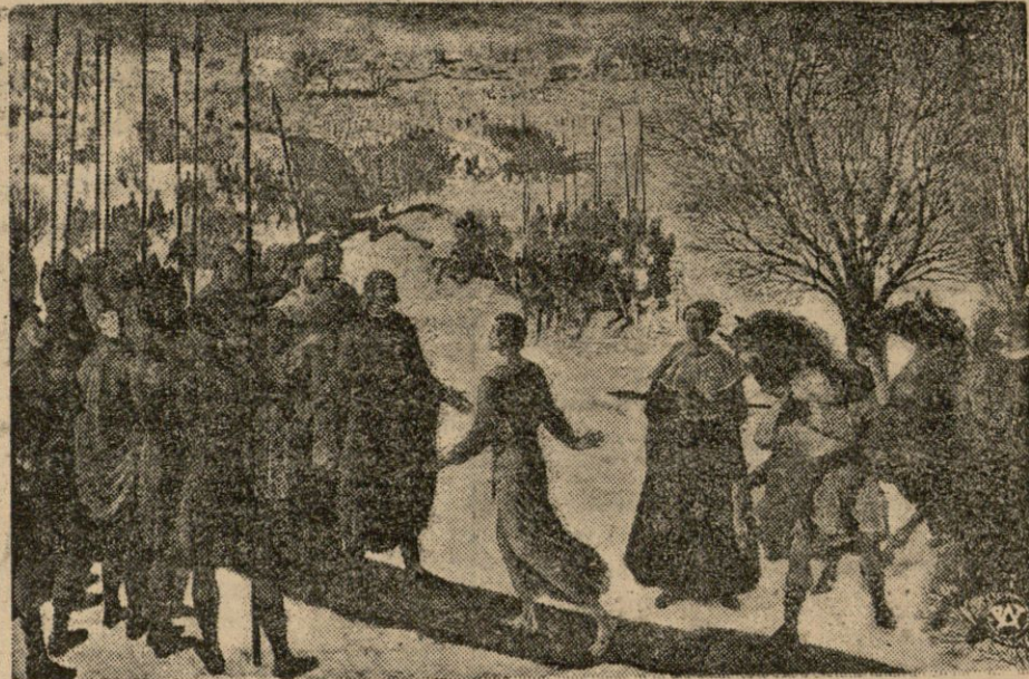
Bolesław Chrobry, witający Ottona III, pielgrzymującego do grobu św. Wojciecha w Gnieźnie. Rok 1000.