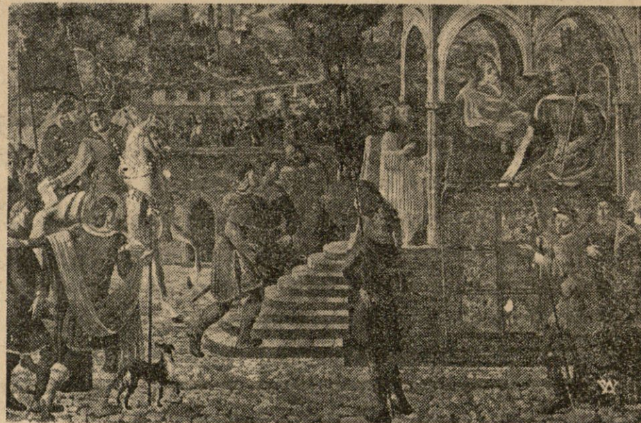
Nadanie przywileju zwanego Jodlnińskim (Nominem captivabimus). Rok 1430.