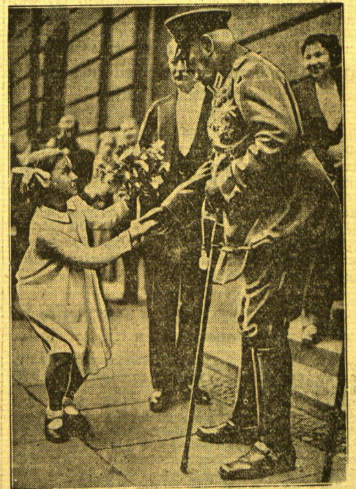
Die Jugend gratuliert Hindenburg