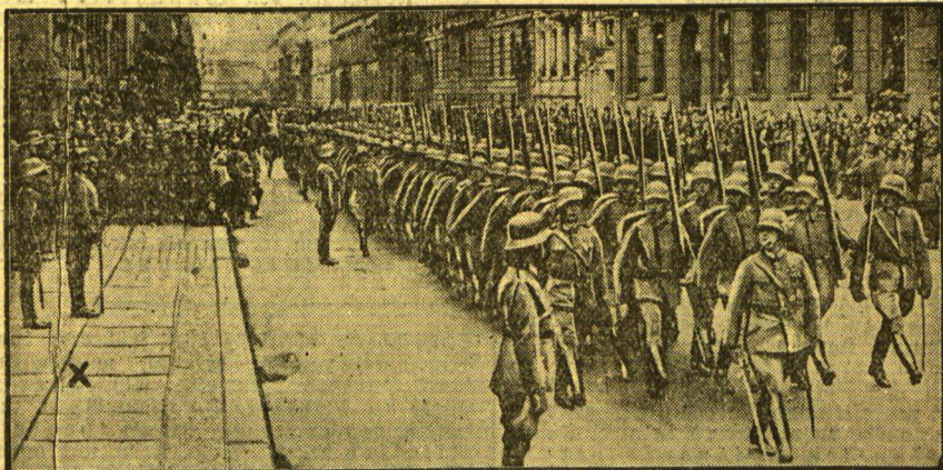
Der Reichspräsident nimmt die Parade der Ehrenkompanie ab