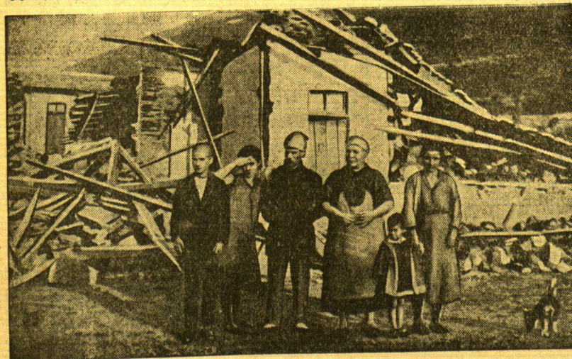
Die ersten Bilder: Weiße Länderstriche auf der Chalkidike sind verwüstet und über 200 Menschenleben getötet worden. Links: Bewohner des Dorfes Perisso vor den Trümmern ihres zerstörten Hauses. Rechts: Die Ruinen der Kirche von Perisso. Die Katastrophe hat bekanntlich 5000 Menschen obdachlos gemacht