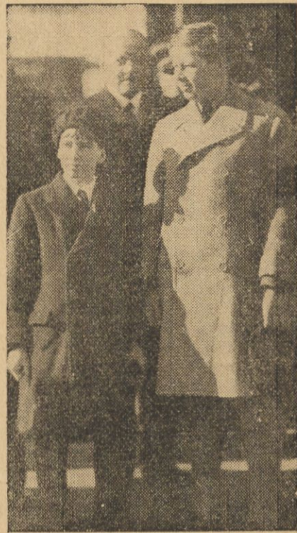
W tych dniach przybył do Białogrodu rumuński następca tronu ks. Michał. Zdjęcie przedstawia ks. Michała na dworcu w Białogrodzie w towarzystwie przybyłego na powitanie młodocianego króla Piotra II.