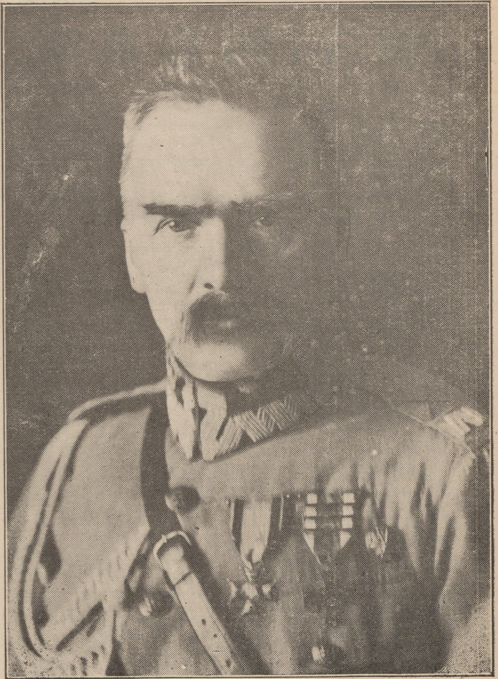
PIERWSZY MARSZAŁEK POLSKI JÓZEF PIŁSUDSKI.