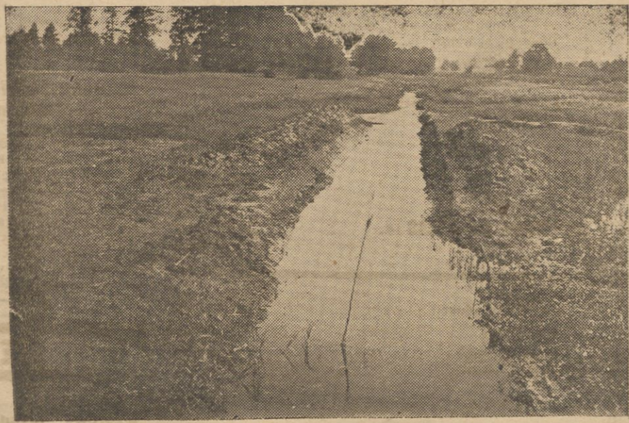
Wiedźma pod Lachowiczami.

— Dziś! Dziś kopią z własnej chęci, bo widzą, jak z każdym metrem