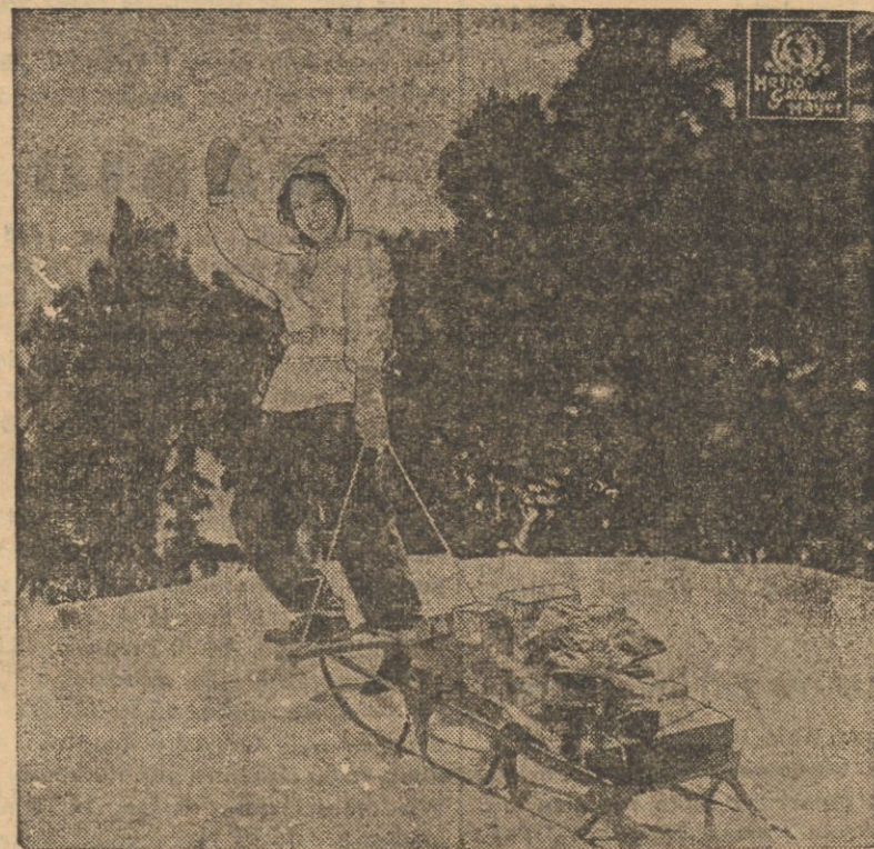
Sanecki naładowane podarkami sportowymi wędrują na górę z okrzykiem radości jedna ze sportsmenek filmowych.