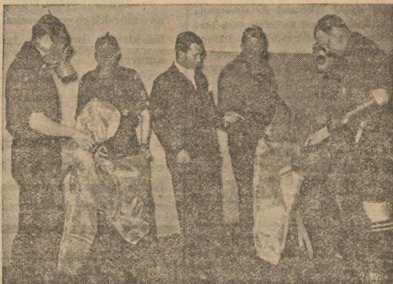
Młodzież szkół szwedzkich przechodzi obowiązkowe przeszkolenie w przygotowaniu do obrony przeciwgazowej. Na zdjęciu widzimy szwedzkich harcerzy w momencie zaznajamiania się z różnymi modelami masek gazowych.