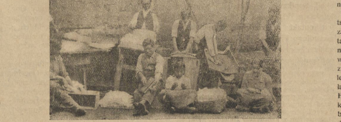
Do najbardziej popłatnych gałęzi przemysłu donowego w republikach środkowej i południowej Ameryki należy wyrób kapeluszy panamskich. Na zdjęciu naszym widzimy jedną z takich domowych wytwórni kapeluszy panamskich w Ekwadorze.