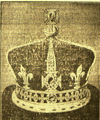
Die englische Königinnen-Krone mit dem Kohinnoor

Sie wurde den unmenslichsten Torturen unterworfen, doch gestand sie selbst auf der Folterbank unter den grauhaftesten Mißhandlungen ihr Verschulden nicht ein. Ihre Dienstreute aber zeigten nicht eine solche Standhaftigkeit. Einer nach dem anderen bezeugte, auf der Folterbank gestreckt und