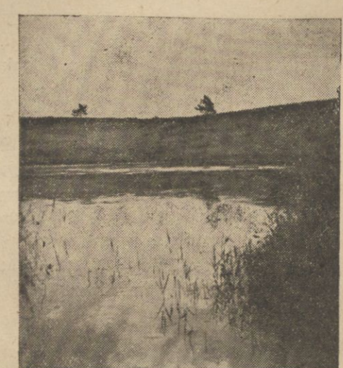
Zejmiana pod Pohulanką.

Wileńszczyzna jest idealnym terenem dla sportu kajakowego, turystycznego. Wielka ilość rzek i rzeczek, piękne jeziora ciągnące się nieraz dziesiątkami kilometrów, tworzą naturalne szlaki w kraju, którego piękno, niestety zbyt mało jest jeszcze spopularyzowane i który pod każdym względem zasługuje na jaknajszczęśliwsze poznanie. Każdy