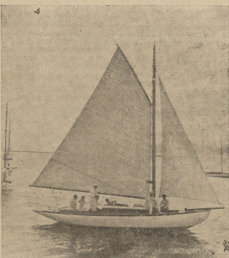
W tych dniach Yacht-klub gdyniński znany ze swej rzutkości i przedsiębiorczości obchodził uroczyste poświęcenie kilku nowych żaglowców. Na zdjęciu naszym jeden z nowonabitych żaglowców.