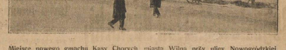
Miejsce nowego gmachu Kasy Chorych miasta Wilna przy ulicy Nowogródzkiej.

Naostatek parę szczegółów natury technicznej co do podziału funkcji przy realizacji omawianej przez nas budowli.