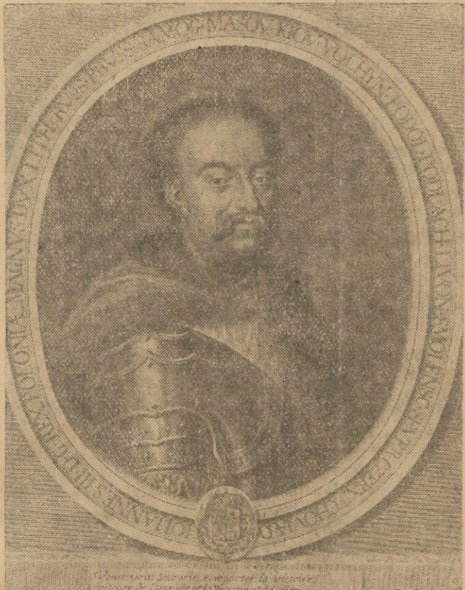
Z okazji przypadającej w r. b. 250-ej rocznicy zwycięstwa odniesionego pod Wiedniem przez Jana III Sobieskiego podajemy portret wielkiego króla oraz portret cesarza Leopolda I-go.