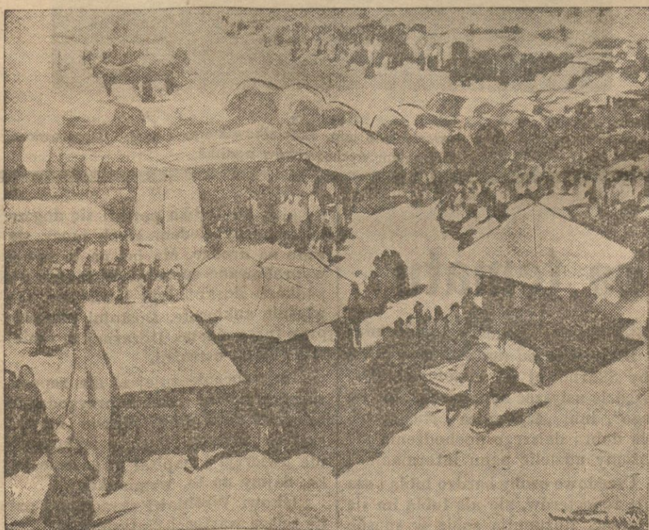
W dniu 22 bm. w salonach „Zachęty” w Warszawie odbędzie się otwarcie wystawy znakomitego artysty-malarza bułgarskiego, Mikołaja Tanoffa. Tanoff jest dobrze znany w Polsce z poprzednich swych imprez artystycznych. Na zdjęciu jarmark bułgarski — Mikołaja Tanoffa.