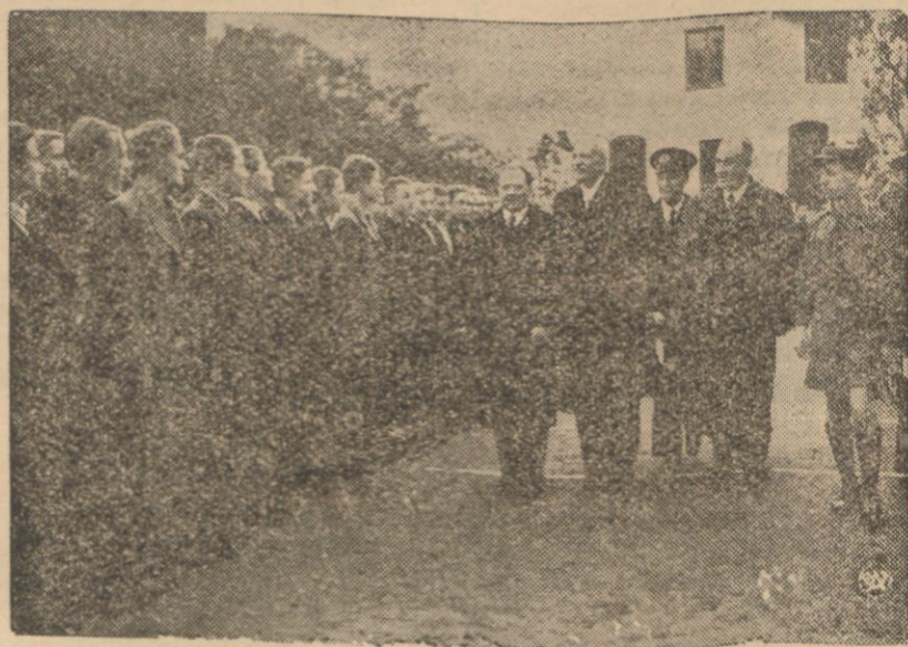
Pan Prezydent R. P. w towarzystwie min. Kościalkowskiego i woj. Jaroszewicza, przed frontem wychowanków ogniska.