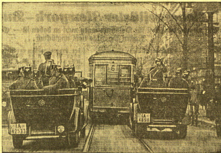
Linkes Bild: Hindernisse, die Streikende auf die Straßenbahnschienen zur Unterbindung des Verkehrs gelegt haben. Rechtes Bild: Einer der wenigen in Dienst gestellten Straßenbahnwagen, der zum Schutz gegen Ueberfälle von Polizeiautos begleitet wird.