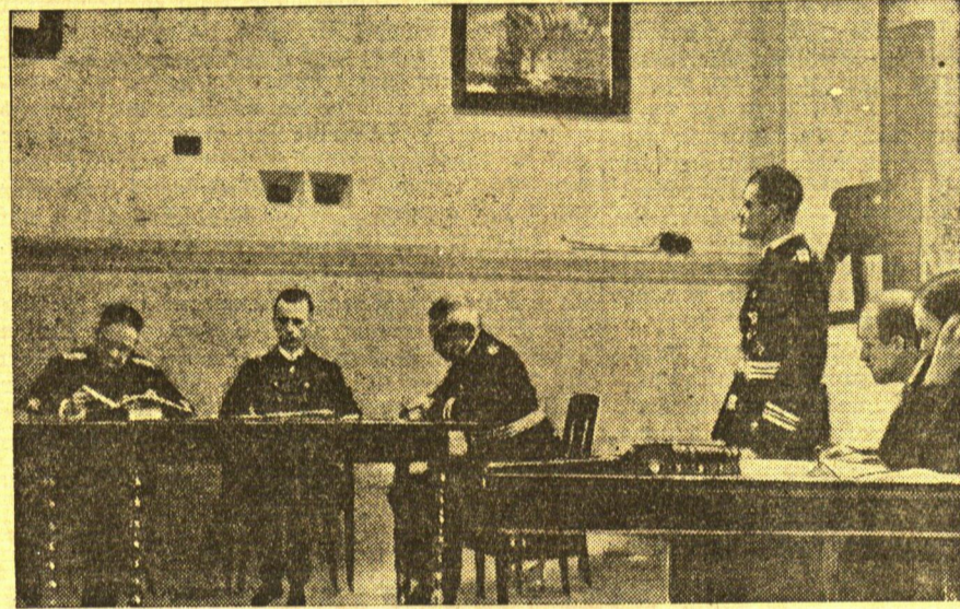
Der „Niobe“-Katastrophe letzter Akt

Eine überrollende See hatte ihren Stahlmast ge-