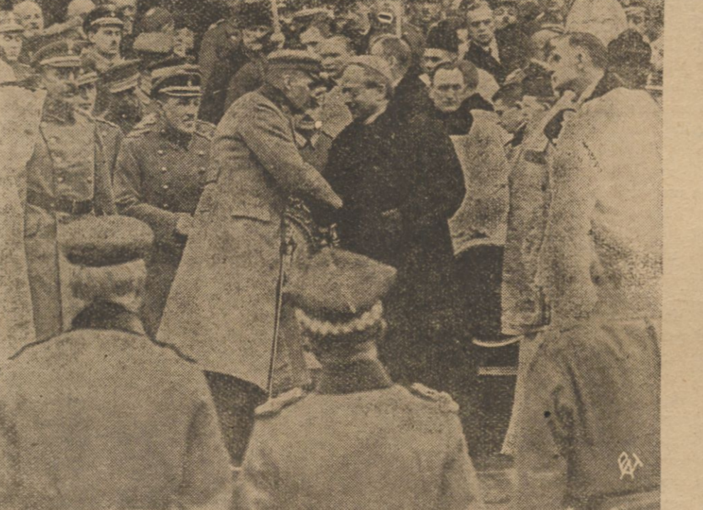
W Warszawie w roku 1920. Marszałek Piłsudski wita ówczesnego Nuncjusza Apostolskiego msgr. Rattiego - dziś Ojca św. Piusa XI