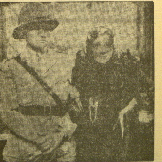
Marlene Dietrichs neuester Erfolg

heit zugesichert, wenn er die Phiole zurückbrachte. Zugleich wurden die Radioabonnenten aufgefordert, die Phiole, deren Aussehen genau beschrieben wurde, im Falle der Auffindung entweder bei der Polizeidirektion oder im bakteriologischen Institut ungeschützt abzugeben. Nach der Ausrückung des Professors Hylman würde der Inhalt der sechs Phiole an einen, um damit Tausende von Menschen zu infizieren.