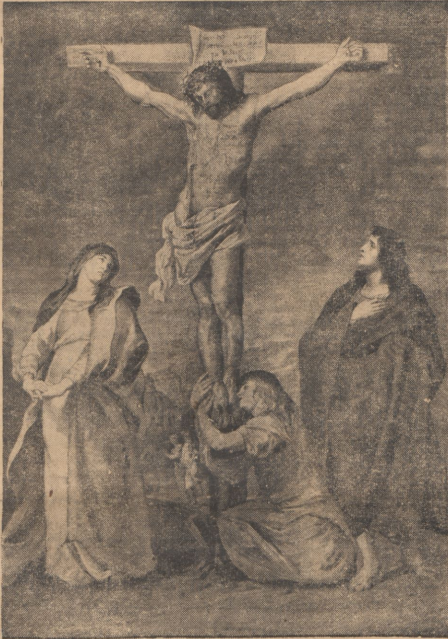
Obraz P. P. Rubensa.