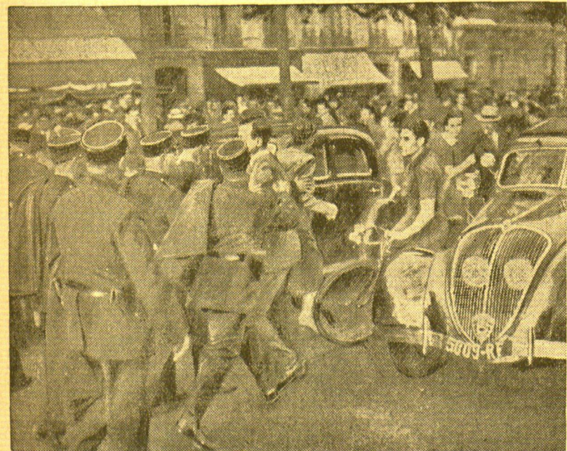
Zusammenstoß zwischen Rechts- und Linksgruppen auf den Champs Elyées Noch immer ist in Frankreich keine Ruhe eingekkehrt. Täglich kommt es zu Zusammenstößen zwischen Rechts- und Linksgruppen. Hier sieht man die Polizei beim Eingreifen auf den Champs Elyées, wo 2500 Anhänger der Rechten mit politischen Gegnern ins Hand-gemeinde kamen