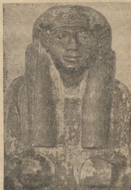
Górna część pokrywy sarkofagu, w którym tym 3100 lat temu złożono mumie egipcjanina. Rzeźba daje pojęcie o specjalnym typie rasowego egipcjanina. W rękach amulety.

Na ścianach sarkofagu nieznanymi artystami umieszczono większe i bogatsze w szeregach malowidła. Są one charakterystycznymi okazami malowideł egipskich, z przed kilku tysięcy lat. Pozbawione perspektywy, bez cieni w burwach i o specjalnym ustawieniu ciał ludzkich; zwrócone wprost do widza klatką pierwszą, a z profilu nogi