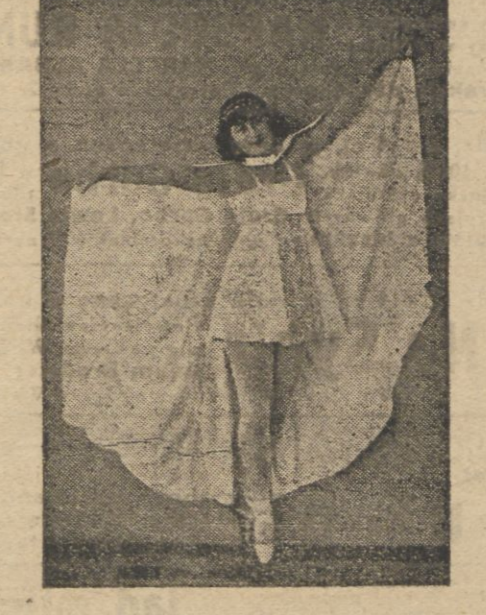
Jedna z uczestek studjum baletowego