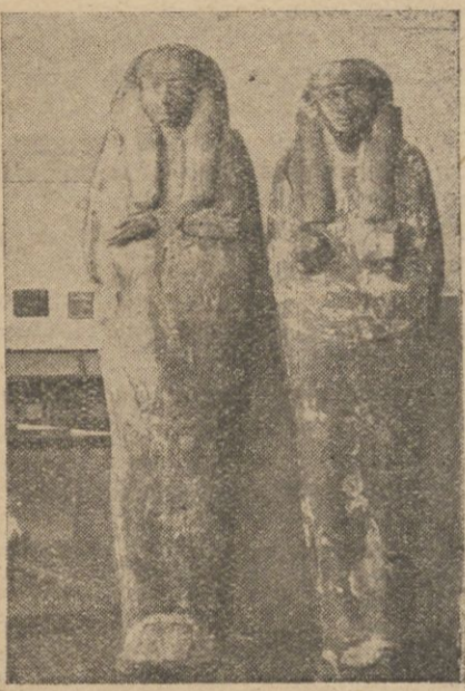
Pokrywy sarkofagów: na prawo — egipcjanina, na lewo — egipcjanin.

W bogatych i ciekawych zbiorach Muzeum Archeologicznego U. S. B. znajduje się oryginalny dział egipski, którego chlubą mogą być trzy, dość duże drewniane sarkofagi z szatkami mumii starożytnych mieszkańców Egiptu. Dział ten jest atrakcyjną osobliwością muzeum. Oczywiście w porównaniu z zagranicznymi muzeami egipskimi, dział ten, liczący niewiele ponad 200 przedmiotów, jest bardzo nikiły i wartości materialna jego jest może niezbyt wielka, ale, jeżeli przyjrzymy sobie, że nawet najdrobniejszy przedmiot z czasów zamierzchłych i nawpół zglebionych, dź-