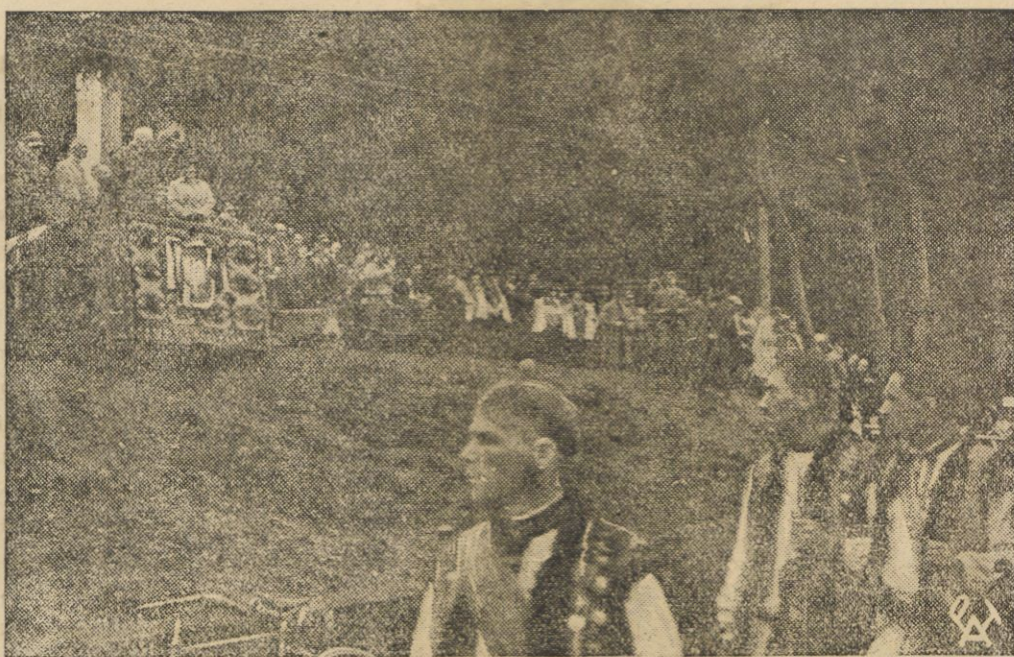
P. Prezydent Rzplitej w towarzystwie małżonki przyjmuje defiladę górali wszystkich regionów górskich od Czeremoszu po Olzę.