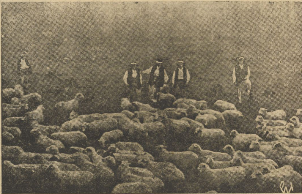
Spęd owiec z hal — jedna z większych atrakcyj uroczystości „Święta Gór“ w Zakopanem