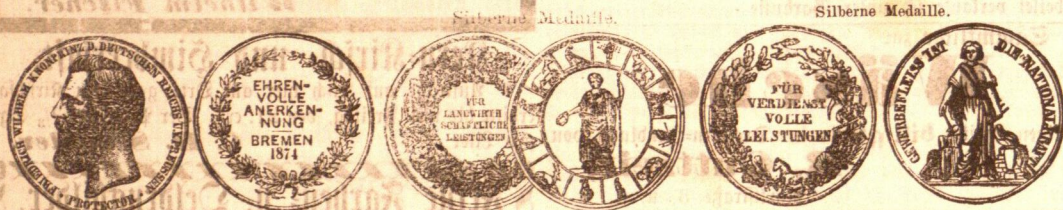
Königsberg i. Pr.

Sonnenschirme und En-tout-cas zu Fabrikpreisen.