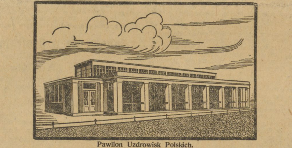
Pawilon Uzdrawisk Polskich.

z otoczeniem przeszedł z vestibulu do drzwi, prowadzących do hali przemysłu włókienniczego i tam przeciał wstęgi, otwierając tym aktem Wystawę.