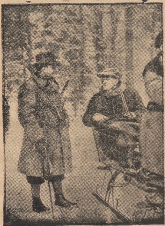
Prezydent Senatu gdańskiego, Greiser, w rozmowie z p. Prezydentem Mościckim na połowaniu w Białowieży

polskiego. Nauczycielka prywatna Pankiewiczówna skazana również została na grzywnę w wysokości 20 litów.