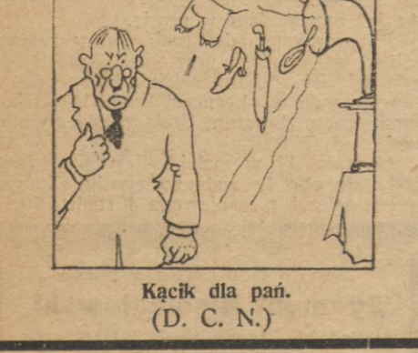
Kącik dla pań.

go zwołano na dzień 24 i 25 bm. do Wilna konferencje naukową, w sprawach pisowni żydowskich, pisowni słów hebrajskich pochodzenia, szeregu zagadnień z dziedziny filozofii i t.p. kwestjach naukowych.