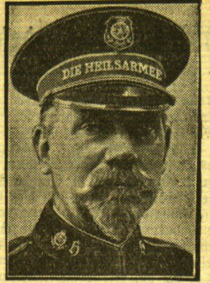
Der neue Kommandeur der Heilsarmee in Deutschland

Eben höre ich aus der Boge an meiner einen Seite eine helle, frische, unverfälscht berlinische Stimme sagen: „Auch, Emmi, sechs Regelbrüder auf