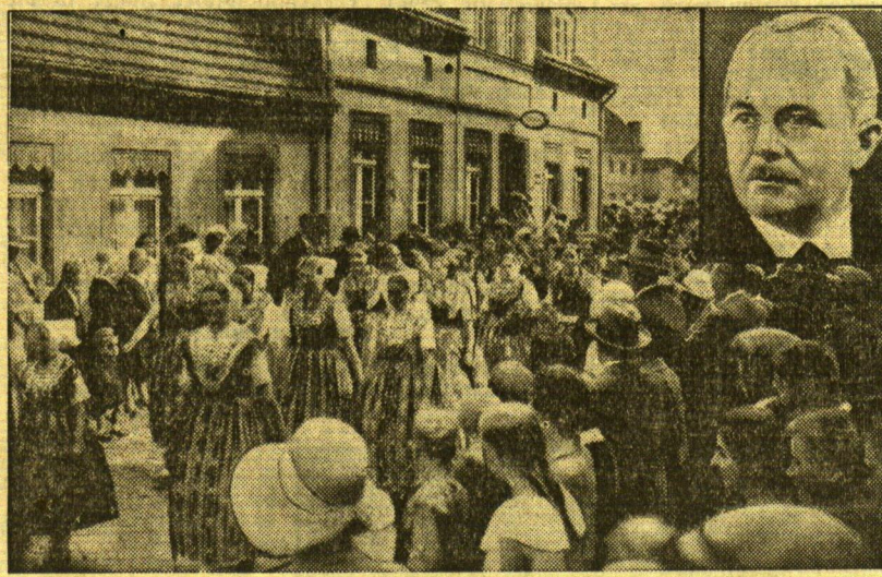
Ein 10.000-Dollar-Weihnachtsgeschenk für Betschau

einmal. Regelbrüder sind immer gut!“ Und gleich darauf schmeichelt dieselbe Stimme ins Telefon hinein: „Darf ich mal runterkommen zum Tanzen? Und darf ich meine Freundin mitbringen?“ Wird fortgesetzt