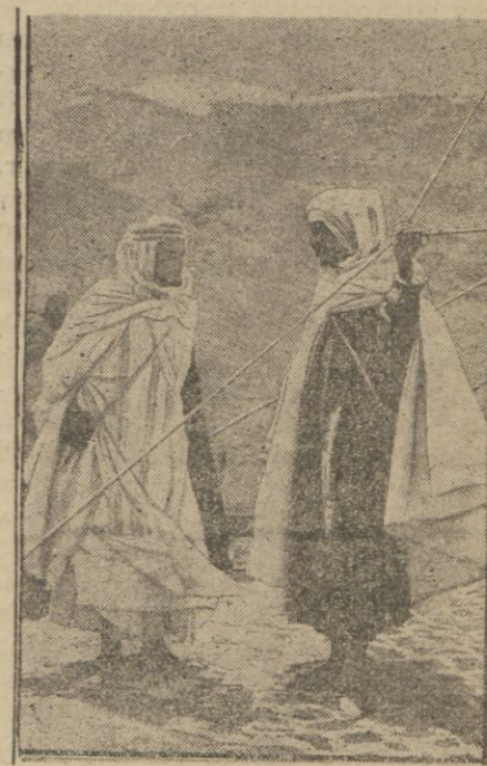
Najpotężniejszym mężem w Maroku nie jest, jakby można sądzić — sultan, lecz pasha Marrakeszu, Si Hadz Thami Glawie, nazywany fabrykantem królów Maroku, widziany na naszym obrazie na prawo. Pasha potrafił zgromadzić olbrzymi majątek, składający się z pałaców, ogrodów, dóbr ziemskich i kopalni.

są liczne ofiary w ludziach. Istnieje obawa, że liczną ofiar powiększy się. Trzęsieniu ziemi towarzyszył ogłuszający loskot. Mieszkańcy wyrzuceni z łóżek wypadli na ulice, gdzie zetknęli się z deszczem rozpalonych kamieni i strumieniami wrzącej wody. Wiele domów runęło w gruz.