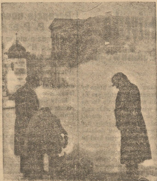
Ustawione na ulicach pęcyki koksowe ogrzewają zmierzniętych przechodniów.

Możemy przyjąć że połowa tego zapasu ziemi będzie zużyta na stworzenie samodzielnych gospodarstw w drodze parcelacji prywatnej. Powstanie ich więc około 20 tysięcy, jeżeli będziemy ostrożni i przypościmy, że suma pożyczki na jedno gospodarstwo wyniesie około 2 tys. zł. to i tak powstanie kwota ok. 40 milionów zł. Jest to suma o wiele mniej znacz-na od cytotanych poprzednio, ALE I TEJ NIE MAMY.