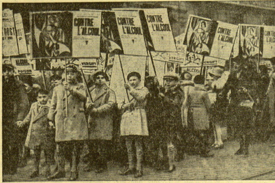
Kinder demonstrieren gegen den Alkohol In Brüssel wurde kürzlich eine machtvolle Demonstration gegen den Alkohol durchgeführt, an der sich auch viele tausend Kinder beteiligten.