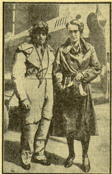
Ein Münchener Ehepaar fliegt um die Welt

enh. Berlin, 24. April. Wie gemeldet wird, hat der Oberreichsanwalt beim Reichsgericht gegen Dr. Goebbels Anklage wegen Hochverratsverdacht beantragt.