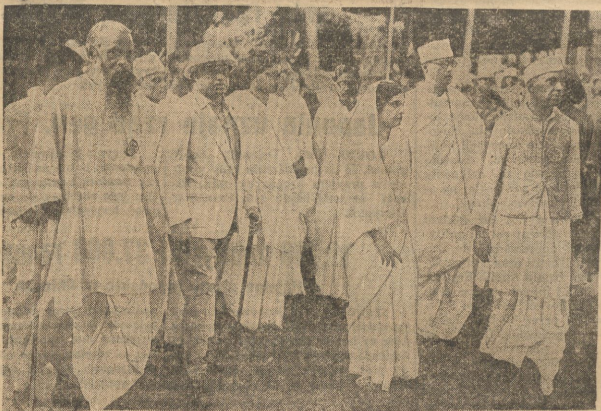
Fragmenci z kongresu nacjonalistów indyjskich w Kalkucie, w którym biorą udział przedstawiciele całych Indji. Na przedzie — przywódca indyjskiego ruchu nacjonalistycznego, na prawo — przewodniczący kongresu Jawaharlal Nehru, obok jego siostra Vijayalakshmi Pandit, pierwsza kobieta minister w Indiach.