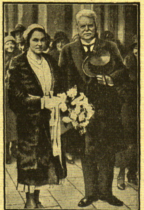
Die Braut wird mit ihrem Schwiegervater getraut

Kinder, die mit O-Beinen herumwackeln, bieten einen recht unerfreulichen Anblick, und in bedauerlich vielen Fällen verliert sich diese Erscheinung auch im späteren Leben nicht. Deshalb muß man Mütter alles tun, diese Mißbildung zu verhindern. Man soll Kinder nicht zu früh laufen lassen, weil oft die Beine noch zu schwach sind, um den Körper zu tragen. Vor allem aber muß man dafür sorgen, die Knochen zweckmäßig zu kräftigen und das Kind so zu ernähren, daß der gefährdete Feind der Kinder, die sogenannte Englische Krankheit, nicht in Erscheinung treten kann. Frische Luft und viel Sonne sind die besten Gegenmittel gegen Englische Krankheit. So früh wie möglich soll der Säugling spazieren gefahren werden; es genügt nicht, ihn etwa im Wagen in den Garten oder auf den Balkon zu stellen, denn er muß bewegte Luft haben. Man soll schon nach drei Monaten dem Kinde täglich einen Apfelsaft oder Fruchtsaft geben, am besten Apfelsaft oder Apfelsinensaft. Nach sechs Monaten fest dann schon die gemischte Kost ein, und zwar ist ein Mütchen mit Gemüsen sehr wertvoll. Nach neun Monaten ist dann vollkommen gemischte Kost zu reichen, und zwar Milch, frische Butter, frisches Obst, Gemüse und dann und wann ein Ei.