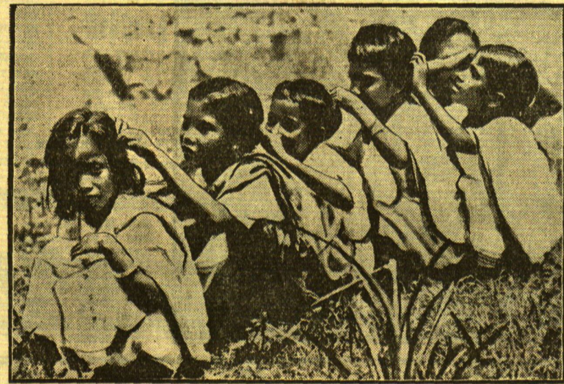
Verdönerung am lauwenden Band

läßt. So lange wie die gesetzliche Erleichterung der Ehescheidung noch nicht spruchreif wird, hängt viel davon ab, wie die gebotenen Möglichkeiten in der Praxis benutzt werden. Den guten Richter zeichnet jene Menschenliebe aus, dem nichts Menschliches fremd ist; das Gebiet der Ehescheidung ist das Gebiet, wo er, durch Paragraphen nicht an allen Ecken und Enden eingeeignet, nach freiem Ermessen entscheiden und über menschliche Schicksale bestimmen kann. Es ist ein in weitesten Frauenreisen geheimer Wunsch, daß mehr Frauen als bisher die schwere, verantwortungsvolle Tätigkeit des Richters ausüben mögen!