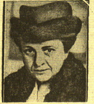
Weiblicher Minister in U. S. A.

Es bleibt der Weisheit des Richters überlassen, ob er brüchige Ehen weiter bestehen läßt oder sie