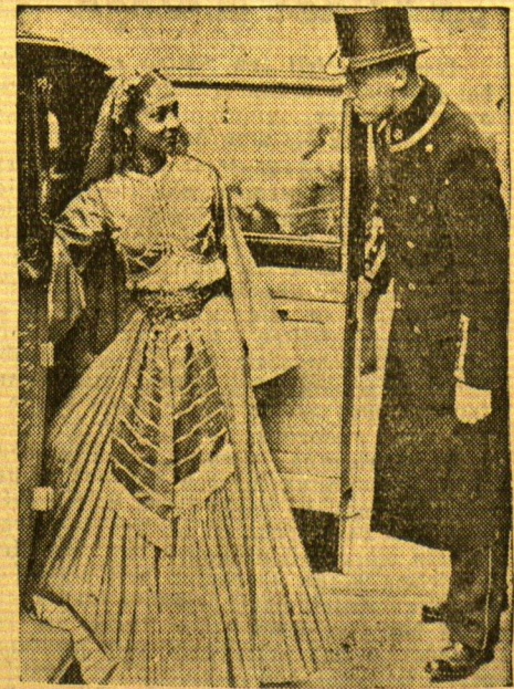
Indonesische Prinzessin wird Filmstar Prinzessin Ronta aus dem Sudan ist in diesen Tagen in London eingetroffen, um in einem englischen Film, der in der Sahara spielt, eine Rolle zu übernehmen. In der malerischen Tracht erregte sie beträchtliches Aufsehen in der englischen Hauptstadt.

In einer Lokloer Schule befindet sich diese Riesendabwanne: Um den Lehrer herum, der selbstverständlich mitbadet, sitzen die kleinen Schüler — eine Unterrichtsstunde, die nützlich ist und trotzdem viel Freude macht.