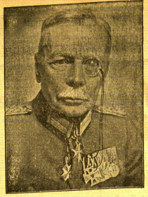
Generaloberst v. Seekt gestorben