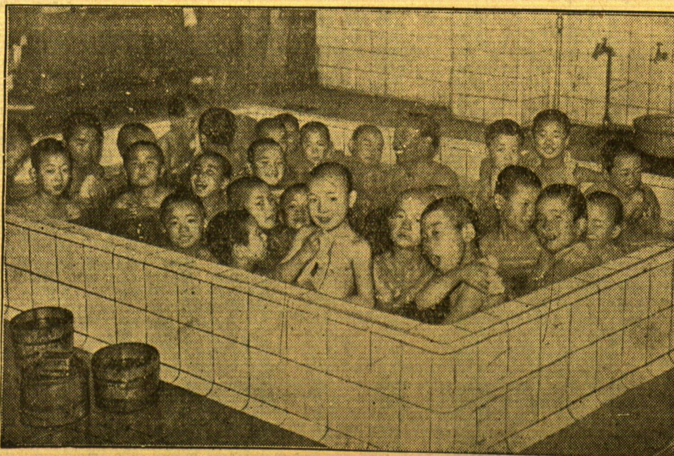
Das Bad in der Schule

In einer Lokloer Schule befindet sich diese Riesendabwanne: Um den Lehrer herum, der selbstverständlich mitbadet, sitzen die kleinen Schüler — eine Unterrichtsstunde, die nützlich ist und trotzdem viel Freude macht.