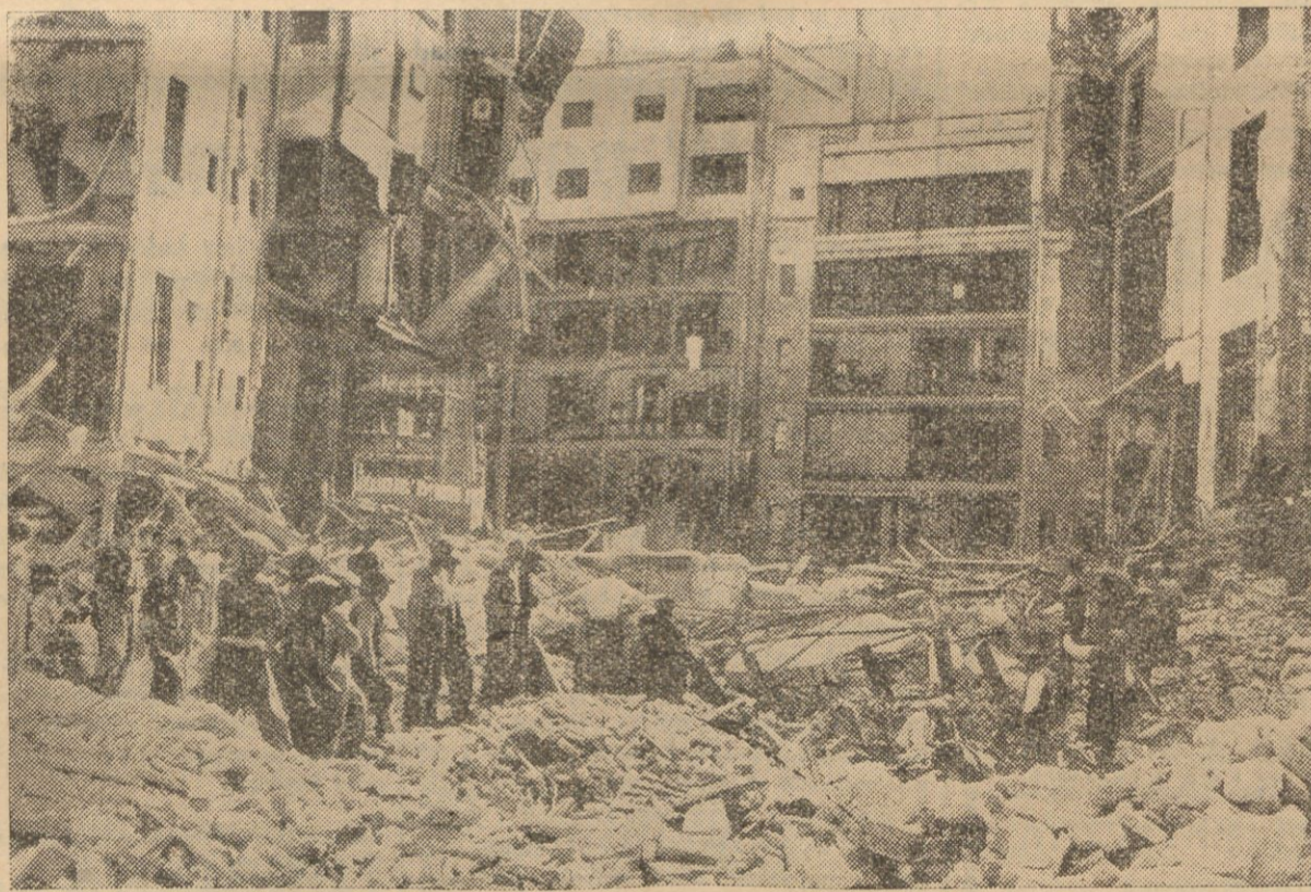
Najazdy eskadr bombowców na miasta wschodniej Hiszpanii pozostawiają po sobie straszliwe ślady. Zdjęcie zrobione zostało w Barcelonie po kolejnym zbombardowaniu stolicy Katalonii.