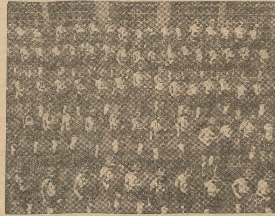
Na zdjęciu fragment z wielkich ćwiczeń w biernej obronie przeciwgazowej, które nieustannie odbywają się w Pradze.