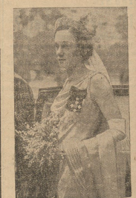
Sławna rekordzistka lotnicza z Nowej Zelandii, Jean Botten, została w tych dniach przedstawiona królowi angielskiemu, Jerzemu VI. Na zdjęciu widzimy ją w stroju galowym.