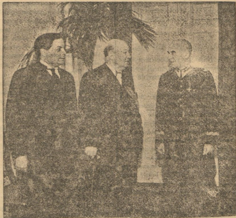
W dniu 26 kwietnia t. j. w ostatnim dniu swego pobytu w Warszawie, minister Robót Publicznych Francji p. de Monzie został przyjęty w towarzystwie ambasadora Francji p. Noela na audyencji przez Pana Marszałka Śmigłego Rydza. Na zdjęciu od lewej — ambasador Noel, minister de Monzie, P. Marszałek Śmigły Rydz.