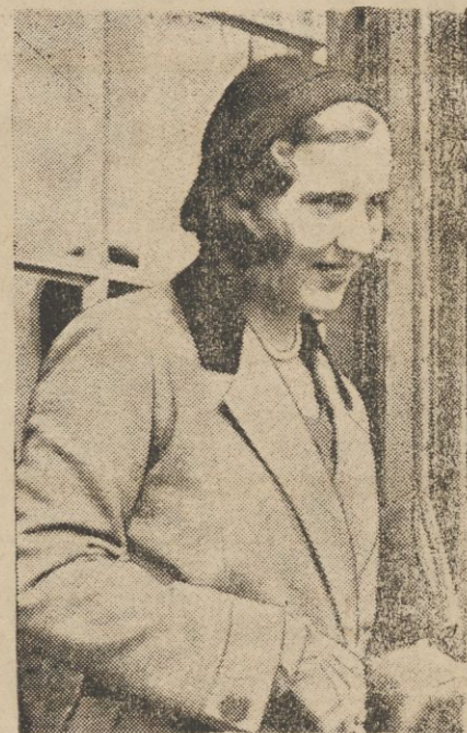
córka szwedzkiego następcy tronu. Bawi obecnie w Anglii. Chodzą pogłoski o jej zaręczynach z księciem Jerzym młodszym bratem ks. Walji.