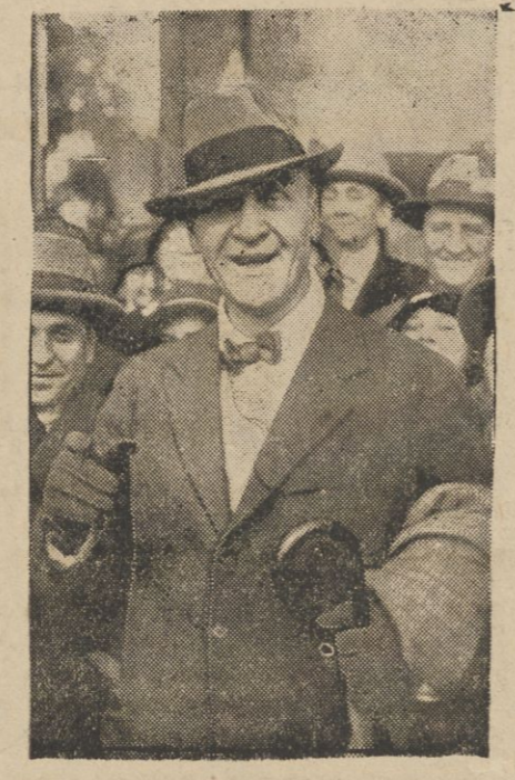
Teodor Szalapin, słynny śpiewak ma wystąpić w filmie śpiewanym.

„Już oddawna jestem rozczarowany do opery — pisze Szalapin — nie znaczy to, że nie odczuwam rozkoszy występowania. Chodzi mi raczej o operę, jako o rodzaj sztuki. Co innego tworzyć, śpiewać same-mu, a co innego być widzianym na sali opero-wej. Przychodzi mi na myśl zdanie słynnego dyrygenta: „Wagner nie może mnie już zainteresować i wzruszyć gdy siedzę na wi-