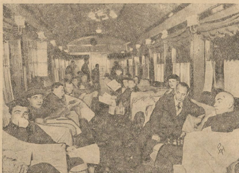
Na linii Moskwa — Tyflis kursuje od nie- dawna pociąg luksusowy przebiegający tę przełęczą w przeciągu 73 godzin. Pociąg ten wyposażony jest w luksusowe urządzenia, jak

w salony, wagony radiowe, restauracje i t. d. Na zdjęciu naszym widzimy wagon salono- wy tego pociągu.