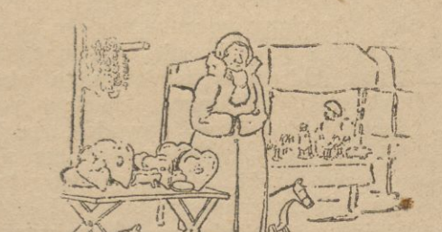
sercu rozrywka. Może niejednemu „nadojadły” już te same widoki dwojczy i wczasy ścisł, a jednak idziemy wszyscy, zwłaszcza