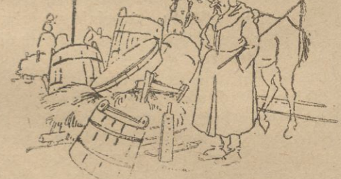
ty już zajęte, wszędzie panował ścisł i gwar. Nic dziwnego. Kaziuk, to nasza, b. bliska

Jakkolwiek dzień św. Kazimierza przypada dopiero dziś, kiermasz kaziukowy rozpoczął się już wczoraj na dobre. Wszystkie miejsca przeznaczone dla straganów zostały już zajęte, wszędzie panował ścisł i gwar. Nic dziwnego. Kaziuk, to nasza, b. bliska