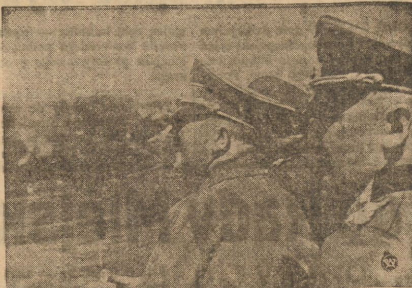
Na zdjęciu — kanclerz Hitler w towarzystwie gen. Witzlebena w czasie podróży inspekcyjnej w Westfalii. Kanclerz Hitler, jak wiadomo, już od tygodnia dokonuje inspekcji fortyfikacji niemieckich na granicy zachodniej, na t. zw. linii Zygfryda.