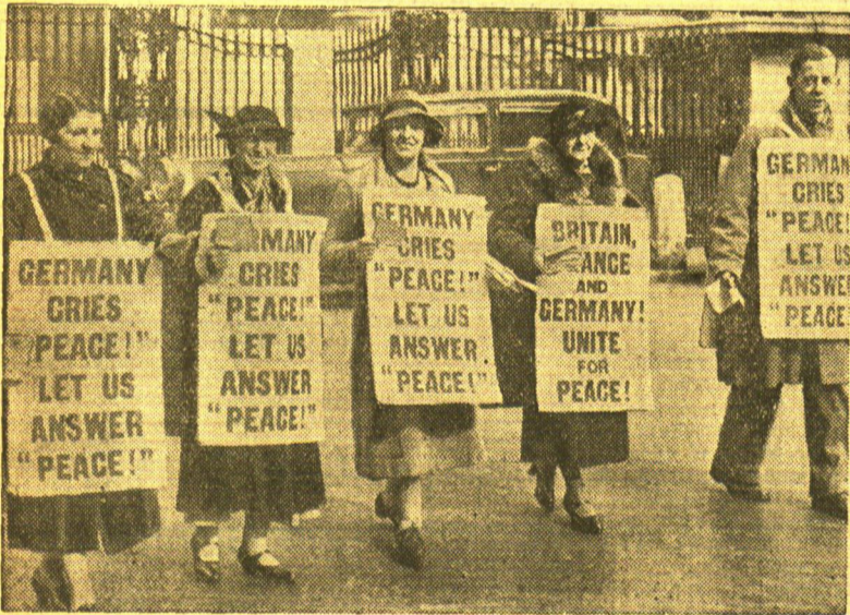
Englands Volk will Verständigung mit Deutschland und den Frieden. In den Straßen Londons sah man eine friedliche Demonstration englischer Frauen, die sich für Verständigung unter den Völkern und für Frieden einsetzten. Die Aufschriften auf den Plakaten lauten: „Deutschland ruht Frieden — wir rufen ihm zu Frieden!“ und „England, Frankreich und Deutschland! Einigt euch friedlich!“