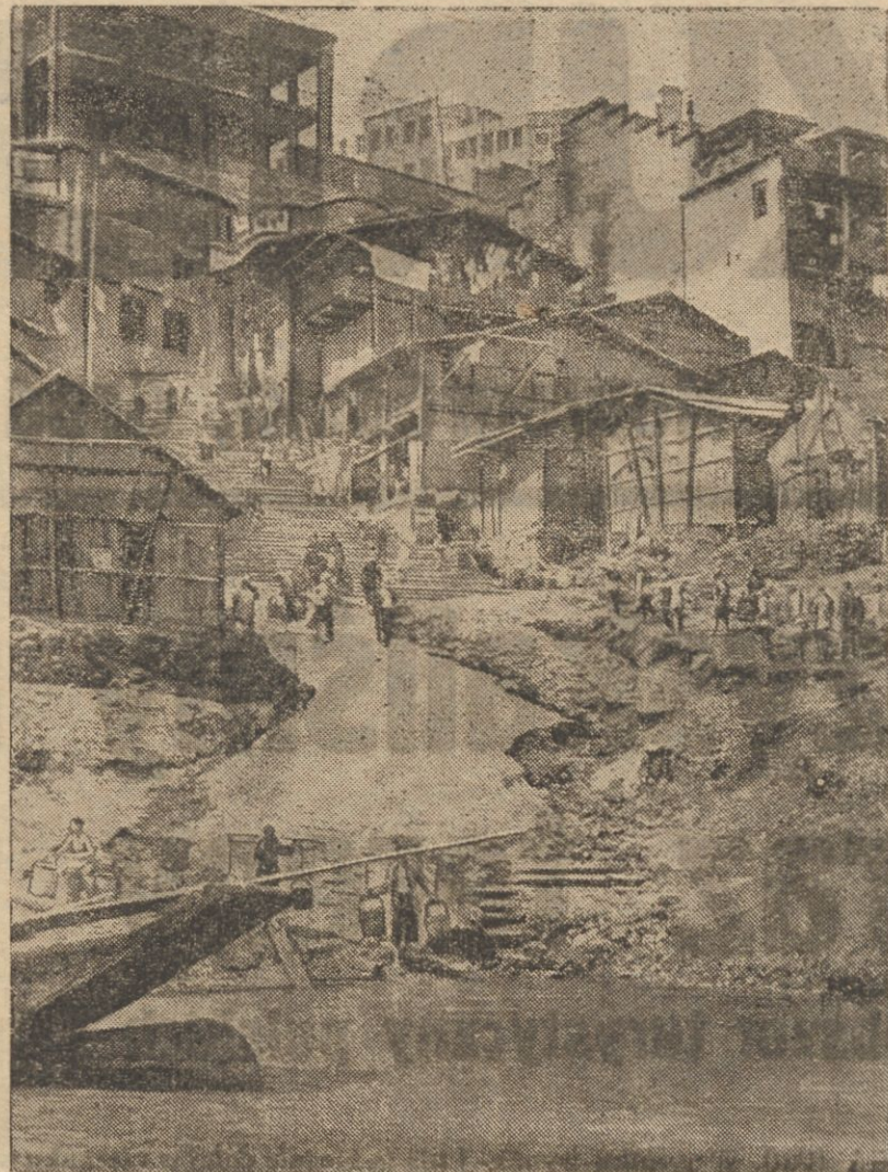
WIDOK NA KANTON.

Ze szczerym żalem oddał go Wilnu Kraków, oddał go jednak w zro-