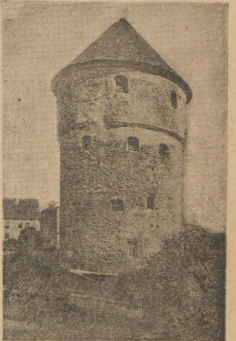
REWEL — TALLIN

We środę 13 sierpnia stanie Pan Prezydent Rzeczypospolitej w Gdyni Zwiedzi tu kilka zakładów przemysłowych, następnie pociągiem specjalnym odjedzie do Warszawy.